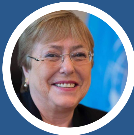
Michelle Bachelet Jeria Ex Presidenta República de Chile

Fue un esfuerzo conjunto que se integró el Ministerio de Educación las comunidades educativas, las instituciones de educación superior pero también los profesores, la familia y por supuesto los chiquillos. No esperamos que se hubiera aprobado la gratuidad para poder emparejar la cancha. Pero yo creo que el PACE ha sido súper importante y a mí me invitan a muchas universidades a hablar y yo siempre pregunto ¿Cuántos PACE hay?