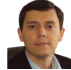
Académico EIC obtiene jerarquía académica adjunta