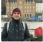
Alumno EIC cursa programa de doble titulación en Italia