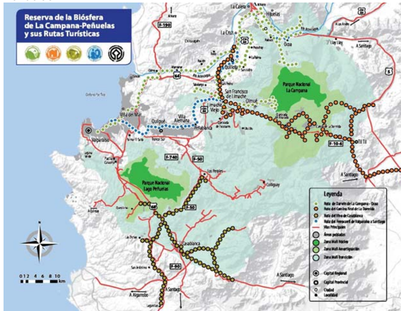
Figura 3 Rutas turísticas propuestas en el Destino Reserva La Campana-Peñuelas