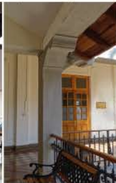
Pre & post restauración pilar corredor