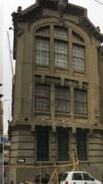
Pre & post restauración calle Yungay general