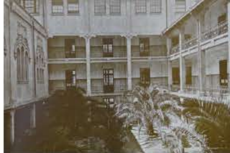
Foto histórica patio interior

Actualmente, la Casa Central cuenta con declaración de Monumento Nacional de Chile en la categoría de Monumento Histórico, mediante Decreto N°355 del 20 de mayo del 2003