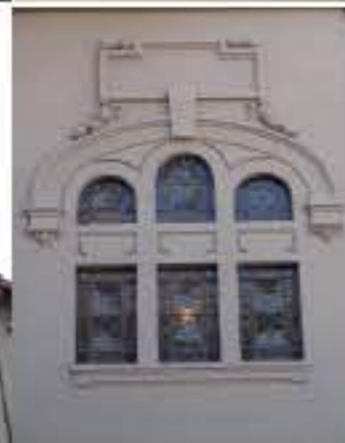
Vista pre & post restauración ventana capilla

Como resultado, se fabricaron e instalaron 413 ornamentos nuevos y se reintegraron 1.453, recuperando las piezas faltantes y trabajando en el lugar. Los ornamentos restantes se encontraron en buen estado de conservación, razón por la que sólo se tuvo que preparar superficie para recibir veladura.