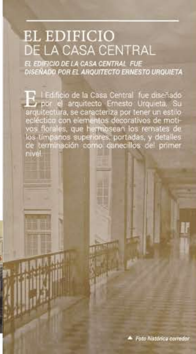
▲ Foto histórica corredor