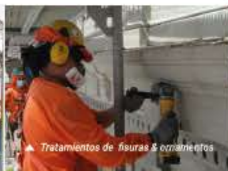
Tratamientos de fisuras & ornamentos