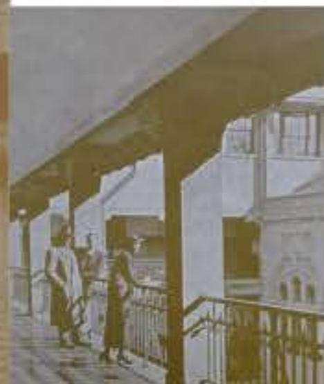
▲ Foto histórica corredor