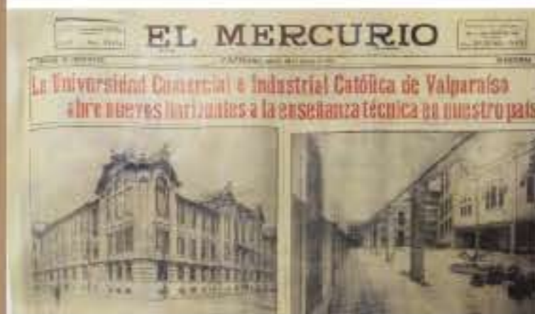
▲ Noticia de la inauguración_24 de marzo 1928